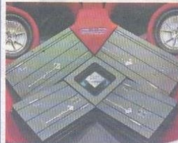
Na parte traseira estão os lançamentos da marca