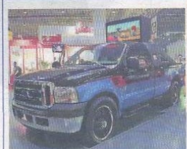
F-350 que está no estande da Pioneer recebeu...