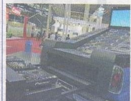
... TV de plasma e mesa para DJ na caçamba

ANA MORANO ana.morano@grupoesafado.com.br